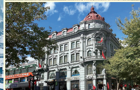
上/清水寺 下/ハルビン中央大道