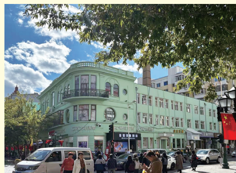
ハルビンの中央大道

故郷について遠くから客観的に考えたり、自分自身が様々な経験を積むことで、建築とそれを取り巻く世界に対する視野を日々広げられていると思う。日本に来てこのような環境のなかで建築を勉強できるのは素晴らしいことだ。