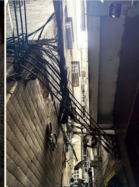
図7 広州の城中村の街並み