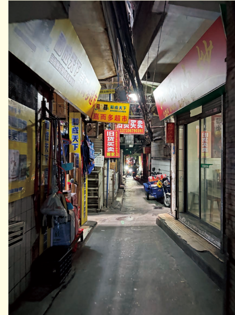
図6 広州の城中村に見られる狭い路地

特に夜になると、路地は暗く、人通りも限られるため、不安を感じることもありました(図8)。一方で、城中村には人と人との距離が近いという魅力もあります。狭い路地の中で自然と会話が生まれ、生活の気配が強く感じられる空間で