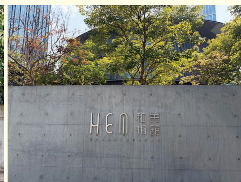
図10 中国・和美術館(入口)