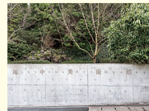
図9 日本・地中美術館(入口)